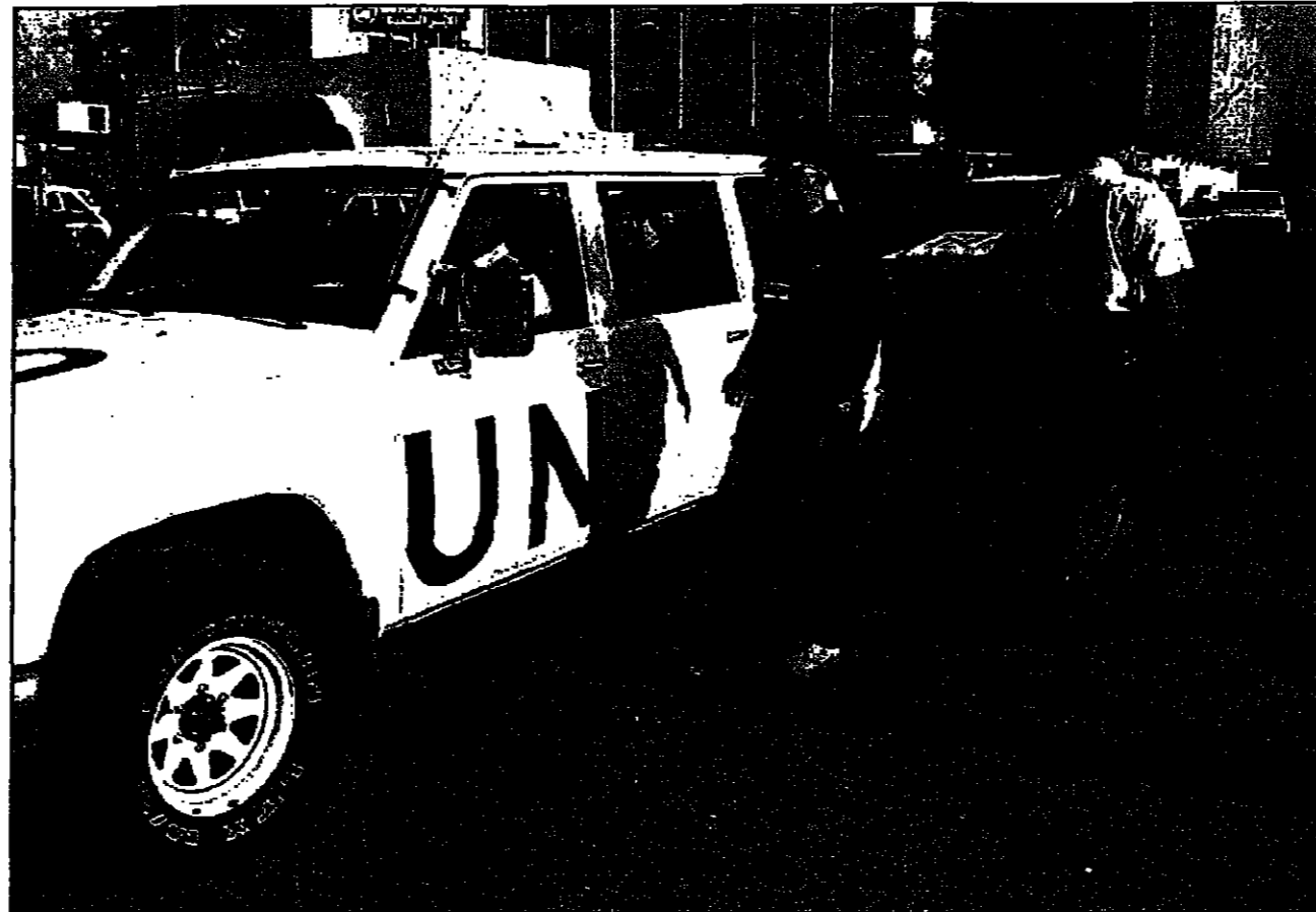
مشقون يستمرون للتحريج الى احد المواقع في بغداد امس

بغداد - من عز الدين سعيدة قتل خيرة الامم المتحدة امس الاحد عددا من المواقع العراقية من دون تسجيل اي حادث لاعتقال لم يحاولوا الاقتراب من مواقع حساسة.